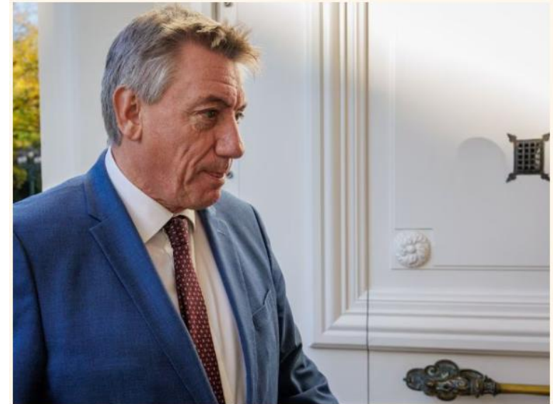
Minister van Financiën Jan Jambon (N-VA).

De meerwaardebelasting zal vanaf volgend jaar alle meerwaarden belasten die vanaf 31 december 2025 worden opgebouwd. Dat bevestigt het kabinet-Jambon aan De Tijd. Zo houdt de regering-De Wever zich aan de oorspronkelijke teksten.